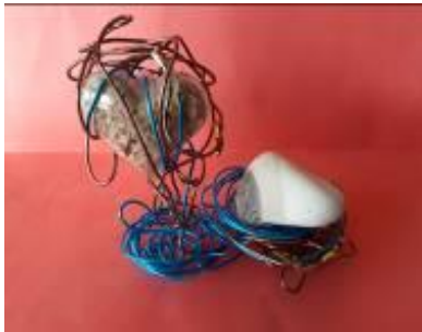
CE2, école Jules Ferry Le Mans

Proposer aux élèves de choisir, individuellement, une pierre pour la sublimer, la rendre précieuse.