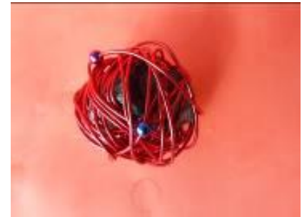
CE2, école Jules Ferry Le Mans