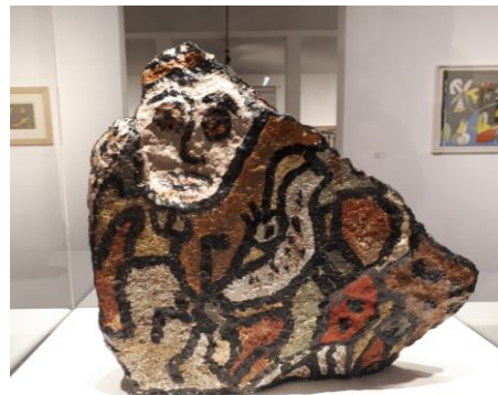
Sans titre, Gaston Chaissac huile sur pierre - 1954