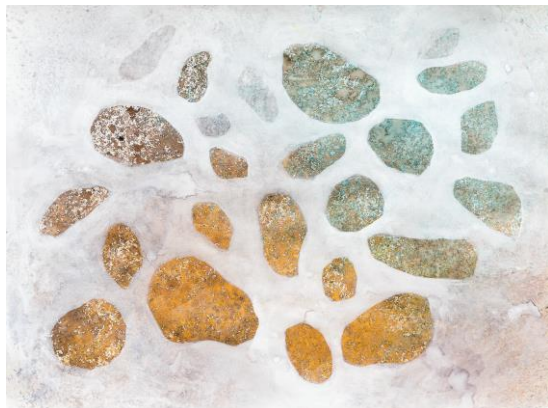
exemple de réalisation atelier proposé par Magalie Ors

Suggérer la pierre en travaillant avec la matière peinture. Jouer sur les projections de peinture ou sur les empâtements pour donner un aspect granitique aux pierres. Les projections pourront être réalisées en frottant son doigt sur une brosse plate, une brosse à dents (penser à mettre un gant) ou en utilisant des pulvérisateurs (le médium devra être liquide : encre ou peinture très diluée). Pour bien délimiter la forme de la pierre, réaliser des pochoirs dans du carton avant de réaliser les projections. Les empâtements seront obtenus en mélangeant la peinture avec un peu de farine ou de semoule fine par exemple.